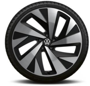
Jantes de liga leve DRAMMEN F: 235/50 R21" T: 255/45 R20"