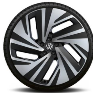
Jantes de liga leve NARVIK F: 235/45 R21" T: 255/45 R21"